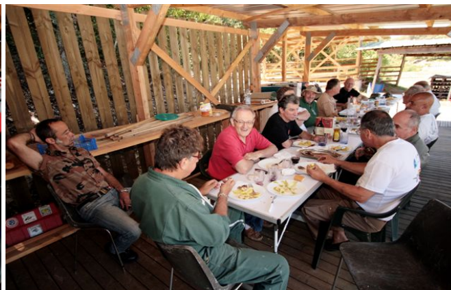
Le coin préparation a été agrandi, entièrement couvert et doté d'un plancher, le tout est également apprécié à l'heure du repas