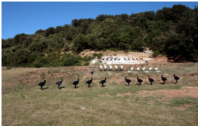
Vue partielle de la ménagerie !!!