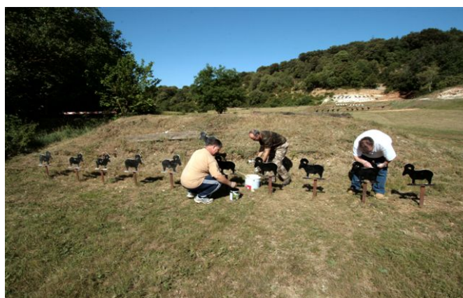
La ménagerie choyée par les tireurs